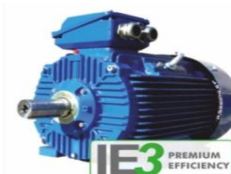
มอเตอร์ประสิทธิภาพสูง