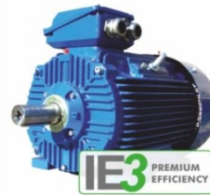
มอเตอร์ประสิทธิภาพสูง