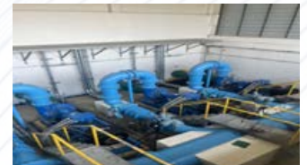
มอเตอร์ประสิทธิภาพสูง