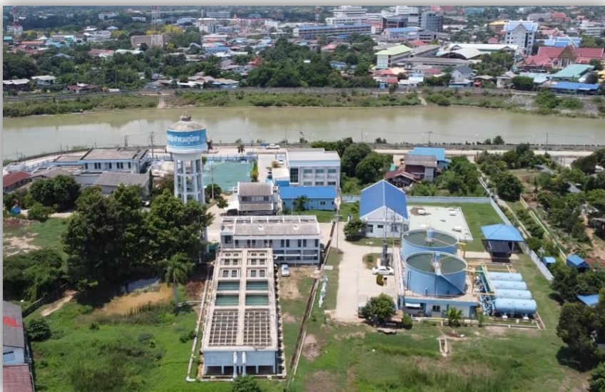
การประปาส่วนภูมิภาคสาขาอ่างทอง

กปภ.อ่างทองมีสถานีที่ตั้งอยู่ใกล้กับแม่น้ำเจ้าพระยา ทำให้มีความเสี่ยงและได้รับผลกระทบจากอุทกภัย ระดับน้ำในแม่น้ำเจ้าพระยาเพิ่มสูงขึ้นเกินค่าระดับน้ำเฝ้าระวัง คือระดับน้ำสูงกว่า 12 เมตร ทำให้ไม่สามารถสูบน้ำผลิตน้ำได้