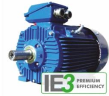
มอเตอร์ประสิทธิภาพสูง

กปภ. ได้มีการนำมอเตอร์ประสิทธิภาพสูงมาใช้งานร่วมกับเครื่องสูบน้ำในสถานีผลิต-จ่ายน้ำของ กปภ. ที่มีการเดินเครื่องเป็นเวลานาน ทำให้เห็นผลการประหยัดพลังงานไฟฟ้าได้ชัดเจน และจะประหยัดพลังงานมากขึ้นเมื่อใช้งานร่วมกับ VSD